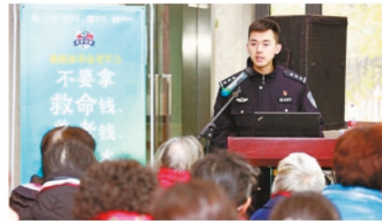
反通信网络诈骗中心法制专家送上防骗秘招