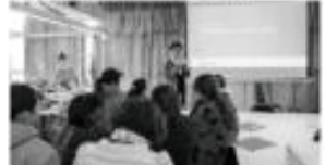
11月23日上午，新密市曲梁镇平安街锦荣衣天下F5栋的工人生产车间，一场接地气的金融防骗知识大讲堂在这里开讲。

天上掉馅饼，地下有陷阱。通过事前教育，才能防骗于未然，这对于想要守护好辛勤忙碌一辈子积攒的辛苦钱的“产业工人”来说尤为重要。