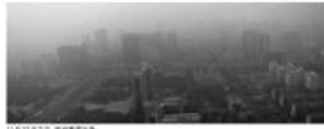
11月27日中午，郑州雾霾严重。

11月27日，河南省空气质量加重，河南18个省辖市全部出现中重度污染，全省PM10浓度普遍超标。昨日河南18个省辖市全部出现中重度污染，未来一周空气质量依然堪忧。